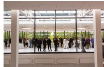
Ein fantastischer Veranstaltungsort: das Kongresshaus Baden-Baden // Un lieu fantastique : le centre des congrès Baden-Baden

(File: 02_Frey_Ackermann_Meyer_MGV_2019_Museums-PASS-Musées.jpg )