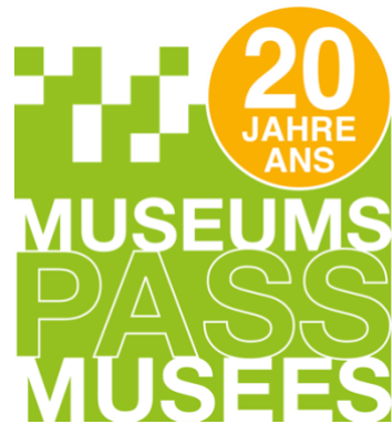
Jubiläumslogo // Logo anniversaire

(File: 05_Statistische_Angaben - Statistiques_Museums-PASS-Musées.png )