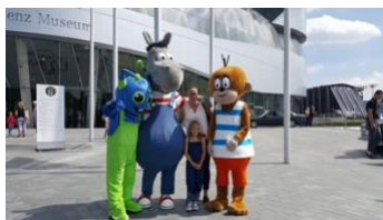
MAARSI in Stuttgart mit Äffle und Pferde // MAARSI à Stuttgart avec Äffle et Pferde

(File: 03_Kongresshaus_Baden-Baden_MGV_2019_Museums-PASS-Musées )