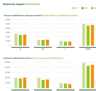
Statistische Angaben – Auszug aus dem Jahresbericht// Statistiques_Museums-PASS-Musées – Extrait du rapport annuel

(File: 04_MAARSI_Stuttgart_MGV_2019_Museums-PASS-Musées.jpg )